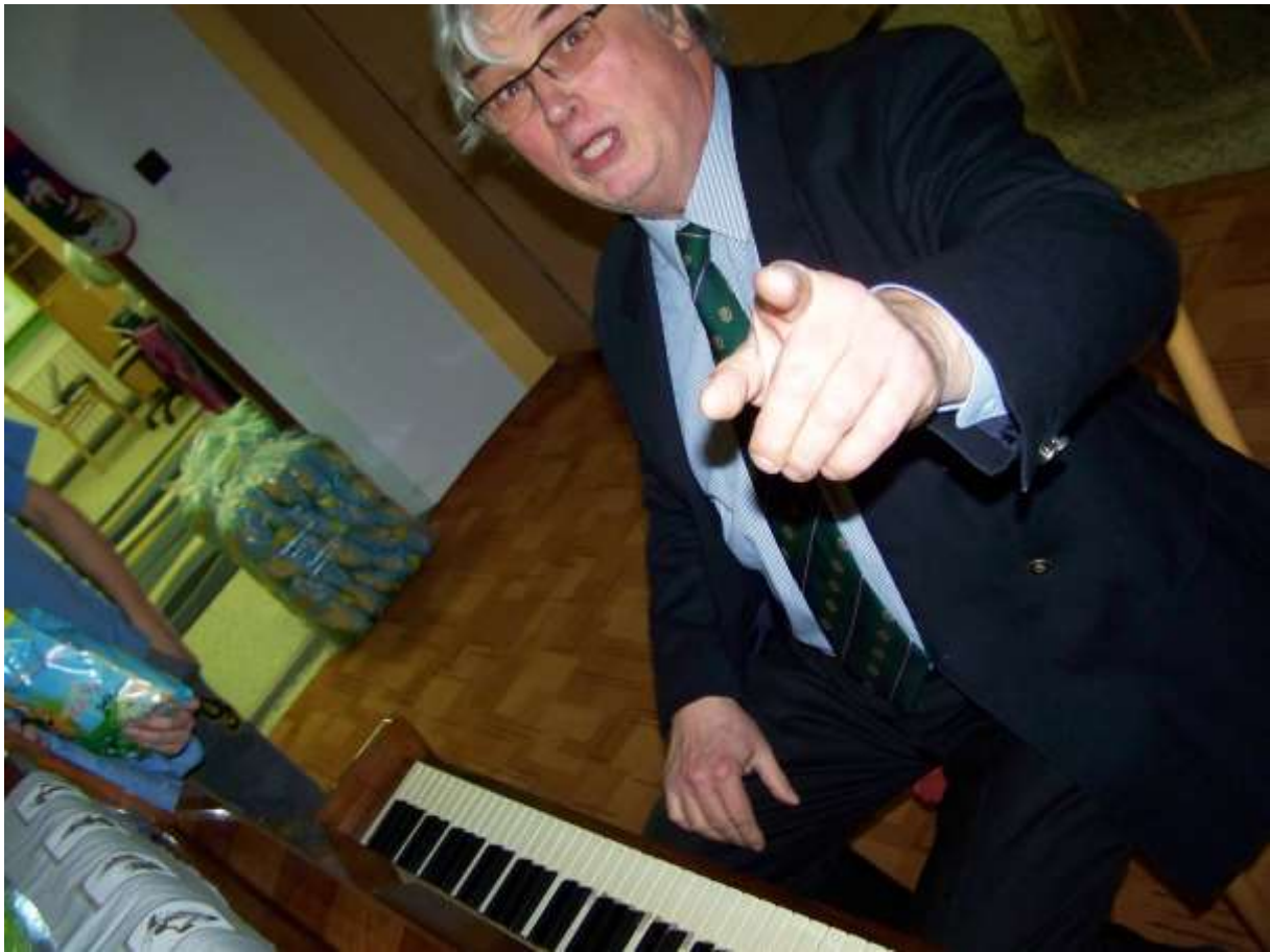
OS 1 – Infraštruktúra vzdelávania: Spojená škola v Trnave